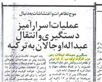
دوگه ستای یران بطور مل را حلی این

کیهان لندن February 25 شماره 746 سال 1999